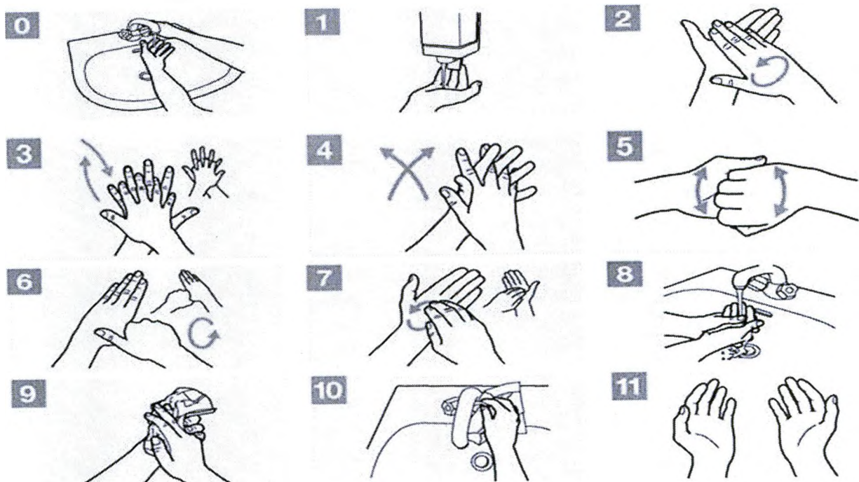
Рис. 11 – Процедура закончена

Рис.10 - Использовать полотенце для закрытия крана